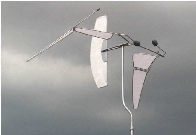
Riding The Clouds