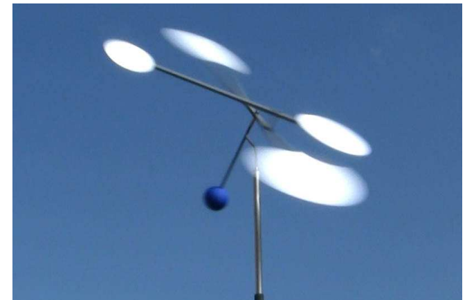
Quelque chose ne tourne plus rond