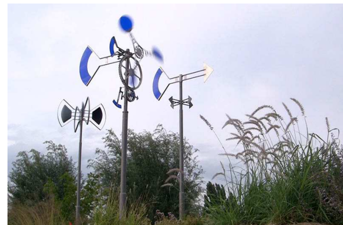
Où va-t-on ? Dans combien de temps ? A quelle vitesse ? Jardin des Traces - Uckange, Lorraine

GARANTIES TECHNIQUES : Les dispositifs éoliens installés en permanence sont conçus pour répondre à la Norme NV65 qui définit la force des vents à prévoir selon les sites. Cette norme permet de choisir les matériaux et les éléments d'articulation assurant la sécurité des personnes et la pérennité des œuvres.