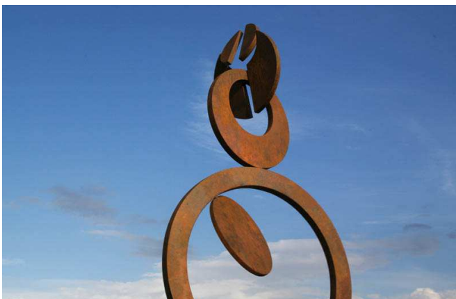
L'impermanence - mobile à sept pièces articulées