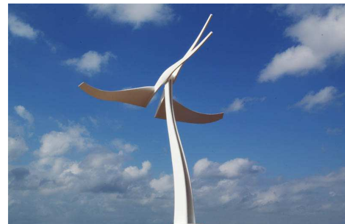
L'envol - prototype de sculpture monumentale