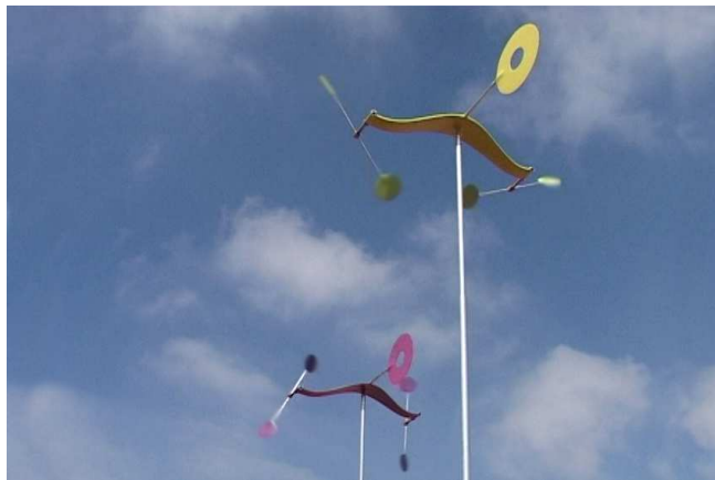
Tourbillon'air - Festival des jardins de Chaumont-sur-Loire