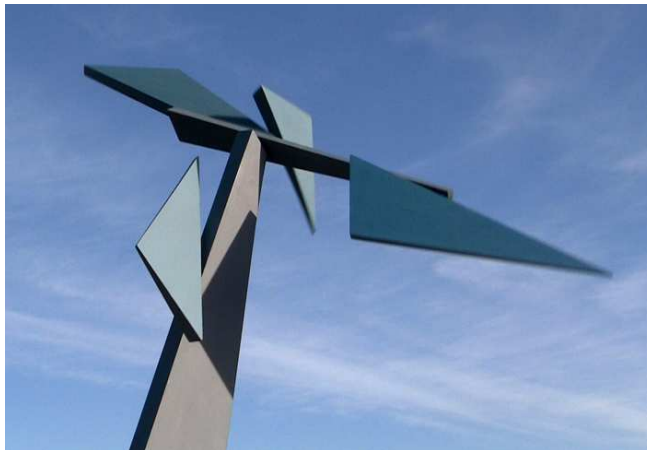
Fragments - mobile à cinq pièces articulées