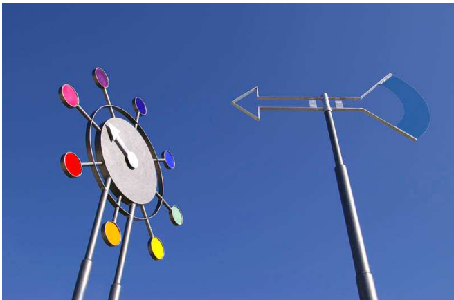
Les vents du Sud - 1% artistique - École Martégaux, Marseille